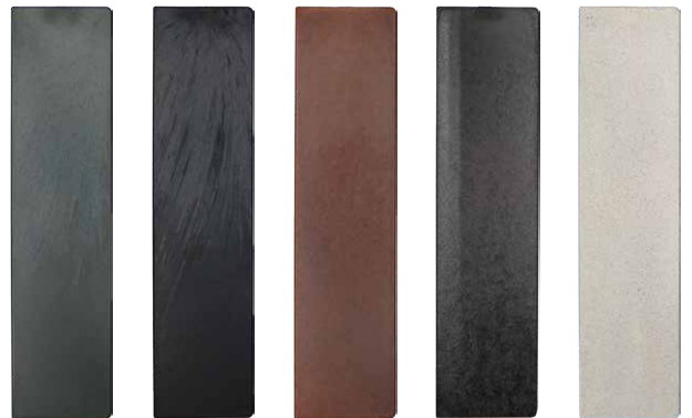
お茶 コーヒー 木くず 竹炭 おから