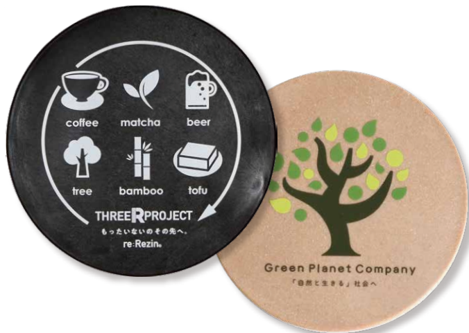
コーヒー / 木くずを使用したコースターに名入れをしたイメージ