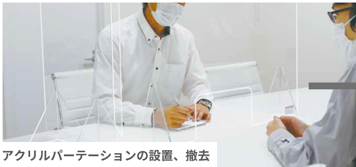
アクリルパーテーションの設置、撤去

PETなどアクリル素材以外が入りますと機械が壊れてしまいます。趣旨をご理解いただき、 確実にアクリルのみを送っていただけるお客様に限らせていただきます。