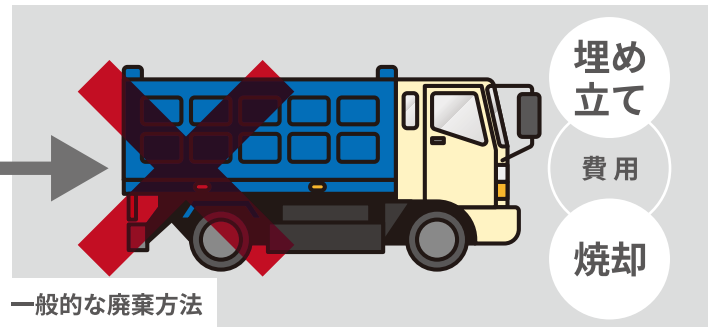
一般的な廃棄方法

コロナ感染対策として、多くの企業や飲食店などが飛沫防止アクリルパーテーションを設置しました。 しかしコロナ終息によってパーテーションは撤去する事になりました。