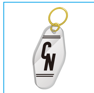
モーターキーホルダー

サイズ | W200×H30mm 名入れ方法 | シルク印刷 (W190×H25mm) UV インクジェット印刷 (W190×H25mm)