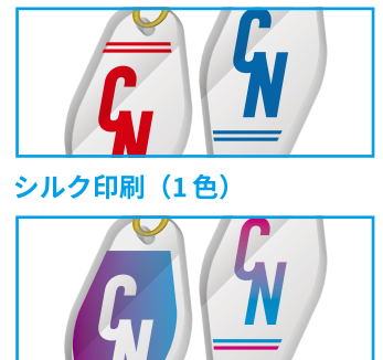
UV インクジェット印刷

サイズ | W90×H40mm 名入れ方法 | シルク印刷 (W84×H34mm) UV インクジェット印刷 (W84×H34mm)